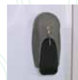
Manija Externa con Llave