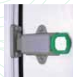
Manija Interna Autoiluminada